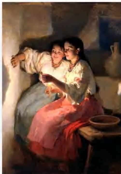
«Святочное гадание» Н. Пимоненко

19 января – Крещение Господне. Православные христиане приходили к водоёму, чтобы окунуться в ледяной воде. Для этого специально проделывали прорубь в виде креста.