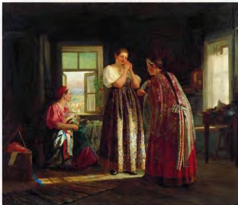
«Сборы на гулянье» В. Максимов

Замужним женщинам полагалось прятать волосы от посторонних глаз. Показаться на людях с непокрытой головой для русской женщины считалось большим позором. Отсюда произошло выражение «опростоволоситься», то есть совершить ошибку, оплошность.