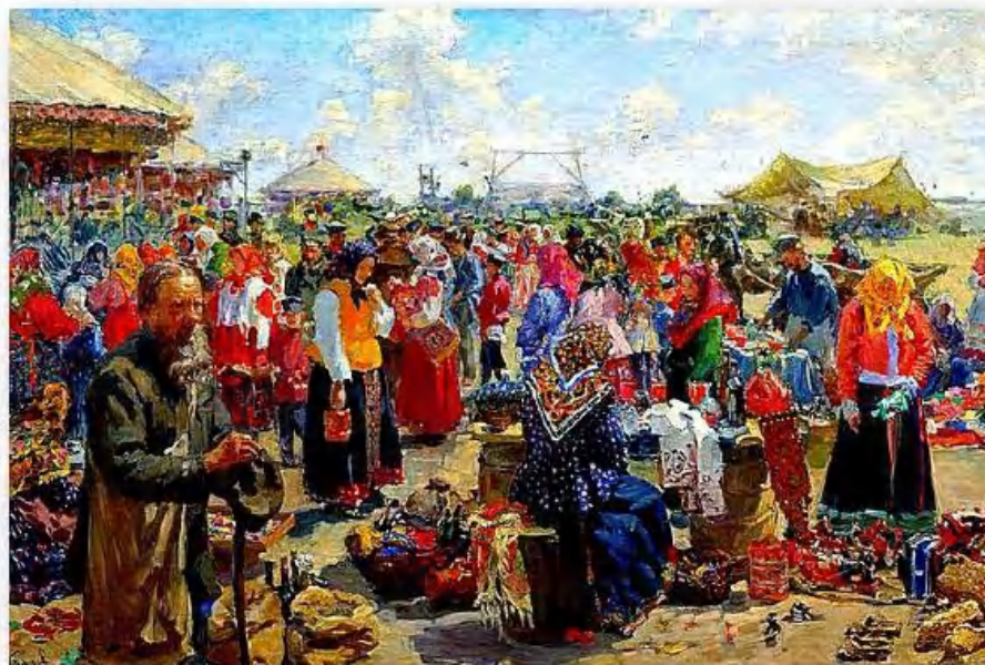
«Ярмарка» Н. И. Куликов

К концу XIX-началу XX века традиционный сарафан всё реже встречался в женском гардеробе. Вскоре его окончательно вытеснил костюм «парочка», состоявший из длинной юбки и кофты. Молодые женщины носили кофты приталенные, пожилые – свободного покроя.