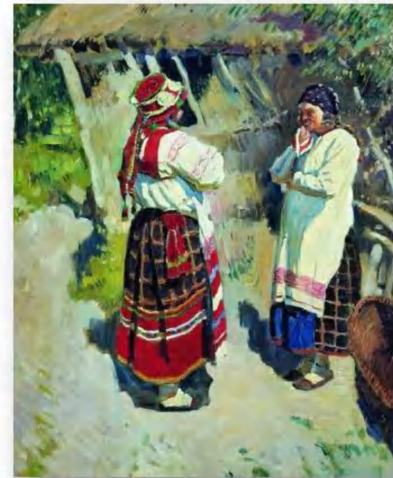
«Бабы тульские» С. Виноградов

В некоторых (преимущественно южных) губерниях России женщины носили вместо сарафана особые поясные юбки – понёвы. Понёва как вид одежды гораздо древнее сарафана. Первоначально «понёва» или «понява» означало кусок ткани, полотенце, пелена, завеса. Известны несколько разновидностей понёв. Распашная понёва – самая древняя. Она не сшивалась по всей окружности тела, как юбка, а состояла из трёх полотнищ, одно из которых располагалось сзади, а два других, пришитых к нему, по бокам. Спереди полотнища не сшивали, так как распашная понёва надевалась непременно поверх длинной рубахи с расшитым подолом. В большинстве сёл такие понёвы носили с «подтыком», то есть поднимали полы и затыкали у пояса, чем достигали необычного эффекта пышности, статности женской фигуры. Более поздняя понёва – плахта – была сшитой кругом, как юбка и не закрывала расшитый подол рубахи. И ещё в такой понёве к трём традиционным полотнищам добавлялось четвёртое, скроенное из другой материи – прошва. Внешне это выглядело как передничек. Носили понёву только замужние женщины или просватанные девушки.