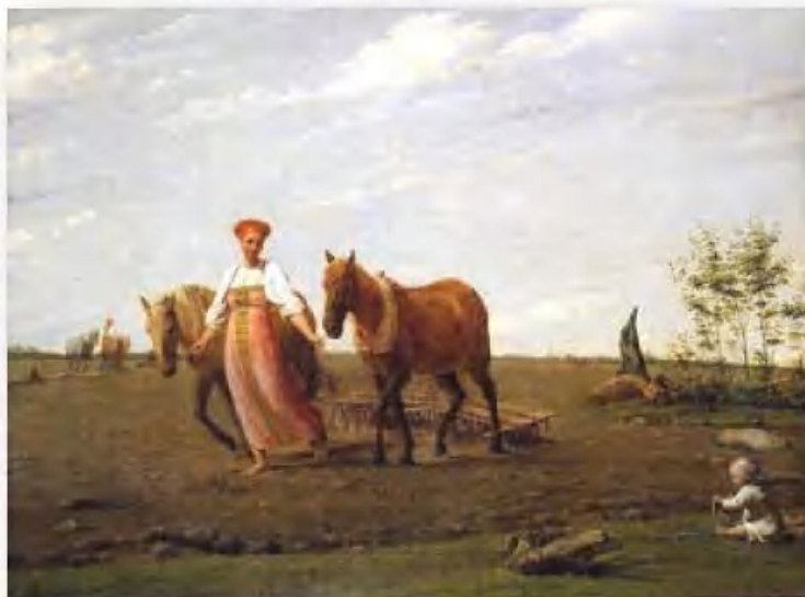
«На пашне. Весна» А. Венецианов

23 мая – Симонов день. В день памяти святого апостола Симона землю считали именинницей. В этот день не выезжали на пашню – это считалась большим грехом.