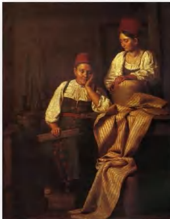
«Ткачихи» А. Тыранов

18 марта – Конон-огородник. С этого дня должно начинать копать огороды. В старинных месяцесловах писалось: «Хотя бы в день Конона была и зима, начинай пахать огород, и ты только почни в этот день, непременно огород будет добр, и овощу будет много».