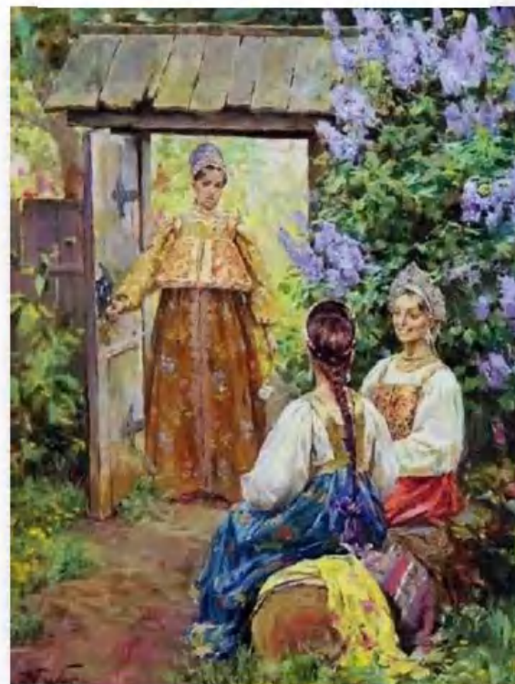
«Разговор под сиренью» С. Бабюк

Вторая разновидность сарафанов – прямые, их ещё называли «московские». Покрой их на удивление прост. Сарафан шился из 4-6 прямоугольных полотнищ, собранных на груди и спине. Подолы сарафанов богато украшались красным сукном, лентами, блёстками, золотой тесьмой.