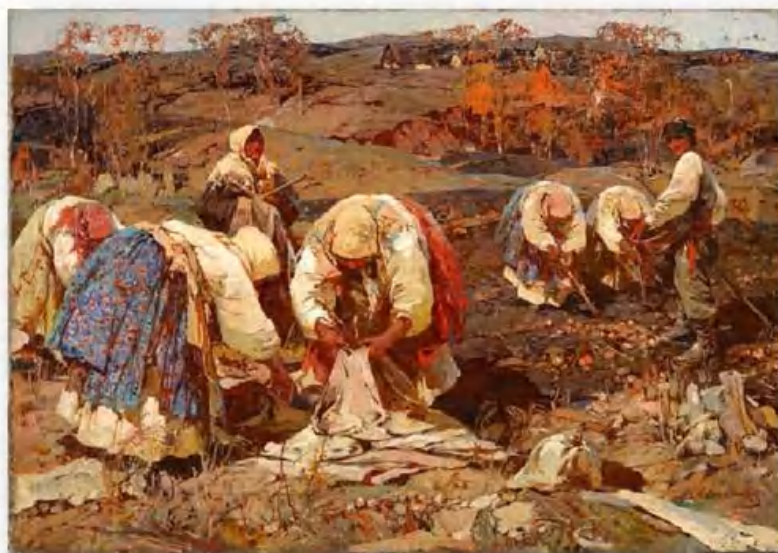
«Сбор картофеля» С. Колесников

30 сентября – Вера, Надежда, Любовь и мать их Софья. Вселенские бабьи именины в честь материнской Мудрости и женских Добродетелей. На Руси всех женщин поздравляли с этим праздником.