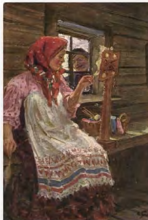
«Прялка» М. Боскин

Одним из самых старинных видов передника бы запон, который шили из одного полотнища, согнутого на уровне плеч, с вырезом для горловины. По бокам передник сшивали, оставляя лишь отверстия для рук.