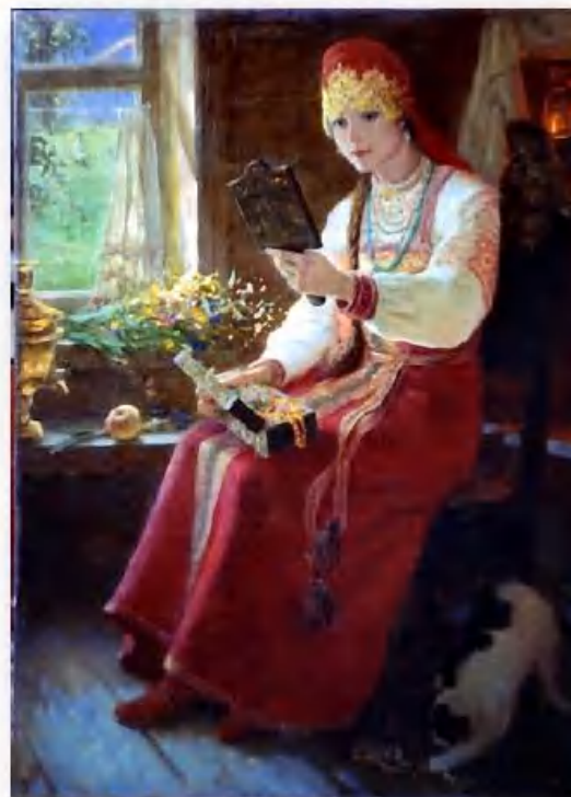
«У окошка» Е. Демаков

Умерших хоронили подпоясанными, а при гадании пояс, как и крест, обязательно снимали.