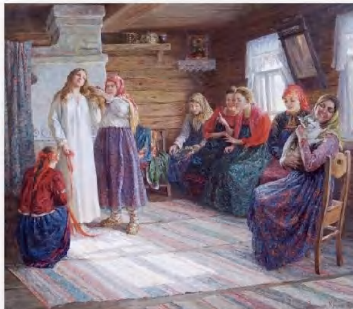
«Крестьянская свадьба» Н. Антохина

Кроме того, у старинной свадебной рубашки были очень длинные рукава, иногда доходившие до подола. Их называли плакальными. Невесте полагалось размахивать ими во время ритуальных причитаний, непременно сопровождавших каждый этап подготовки к свадьбе.