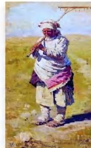
«Крестьянка с граблями» С. Виноградов

Яркие традиции края : [женский праздничный костюм Калужской губернии] // Куклы в народных костюмах. - 2012. - Ноябрь. (№ 21). - С. 8-11.