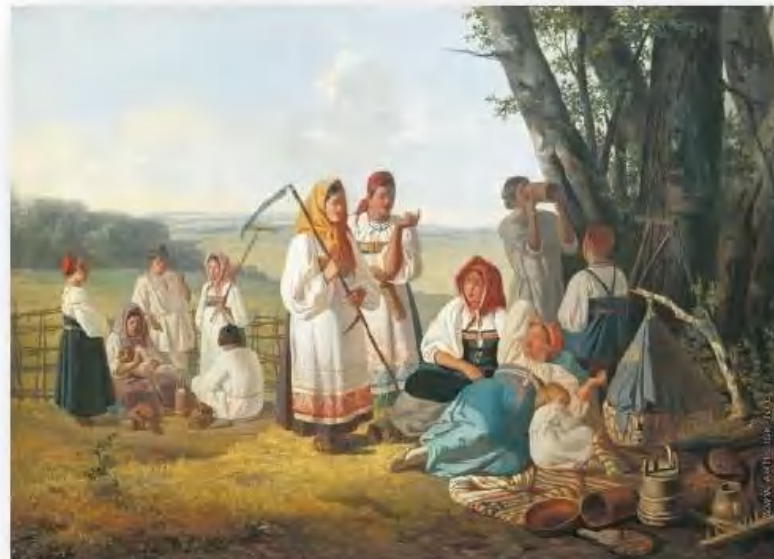
«Отдых на сенокосе» Л. Плахов

21 июля – Казанская. Зажинки. Начало жатвы. К началу жатвы готовились как к большому празднику. Хозяйка мыла дом, хозяин убирал двор, гумно. Стол застилали белой скатертью. Самый первый сжатый сноп несли в дом и ставили в красный угол под иконы.