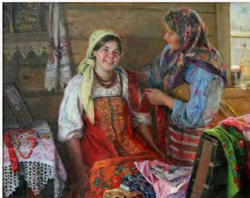
«Собираются в гости» Ф. Сычков

Щеголихи надевали от трёх до десяти платков одновременно. Считалось, что чем их больше, тем наряднее. Сначала – самый большой платок, потом поменьше и так далее, чтобы из-под одного виднелась кромка другого.