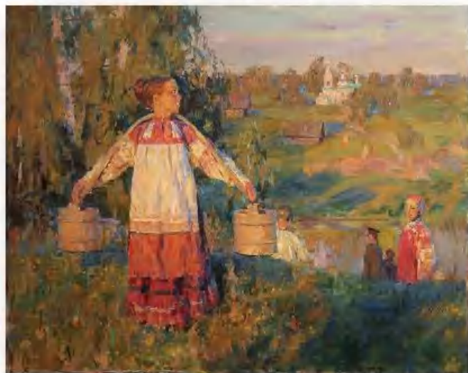
«По воду» С. Бабюк

30 июня – Мануил. В старину по всей Руси в этот день шумели ярмарочные гулянья.