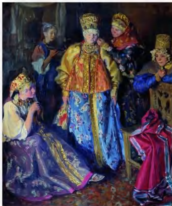
«Убор невесты» И. Куликов

В праздничные дни и по торжественным случаям женщины носили душегрею. Душегрея по крою напоминала верхнюю часть косоклинного сарафана. Но по длине она доходила до талии, а по ширине была гораздо шире сарафана за счёт многочисленных широких складок на спине. Душегреи шили из узорного шёлка, парчи, украшали оловянными пуговицами и шёлковыми петлями.