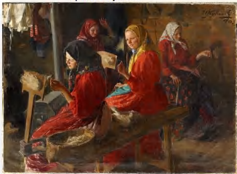
«Пряхи» И. Куликов

22 октября – Яков день. Яков Дровопилец. Наступала пора заготовки дров на зиму. Ещё в этот день было принято варить первые каши из крупы нового урожая.