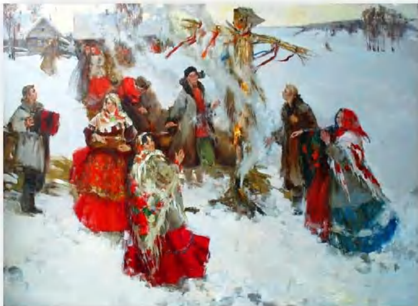
«Масленица» А. Виноградова

25 февраля – Мелетий и Алексий. Выставляли на утренний мороз зерно, предназначенное для посева, говоря, что тронутые морозом семена дают лучший урожай. Выносили на мороз также лён и пряжу, чтобы иметь чистые, ровные и белые нитки и мотки.