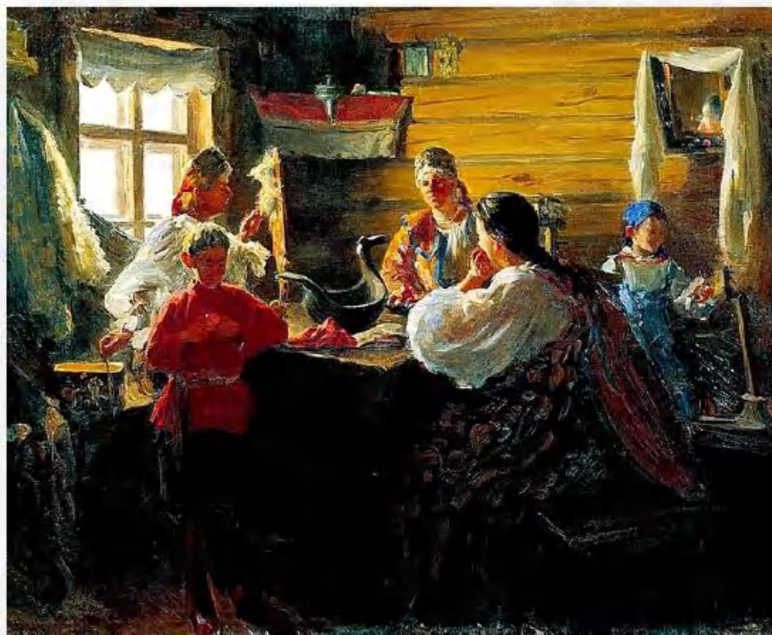
«Зимним вечером» И. Куликов

21 ноября – Михайлов день. Михаил Архангел. Начинались михайловские праздники – пиры да гулянья после окончания всех летних и осенних сельских работ.