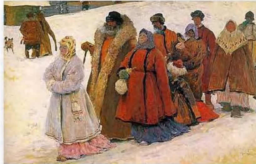
«Семья» С. Иванов

Тулуп носили нараспашку или подпоясывали широким кушаком, который завязывали узлом спереди, а концы затыкали справа и слева за кушак. Воротник поднимался вверх и подвязывался у горла шарфом или платком, а то и просто верёвкой. Отправляясь в дальнюю дорогу в сани, тулуп надевали поверх шубы или полушубка.