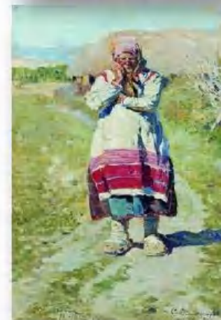
«Крестьянка» С. Виноградов